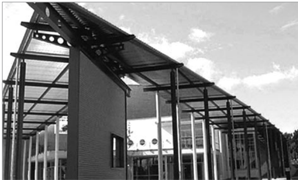
Ort der Veranstaltung: Filharmonie Filderstadt